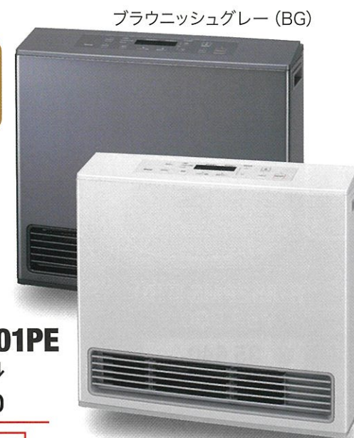
ブラウンッシュグレー (BG)